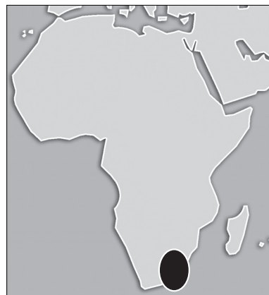
Répartition spatiale des Australopithecus africanus .

L'appareil locomoteur montre une aptitude au grimper et une marche plus assurée que pour Lucy.